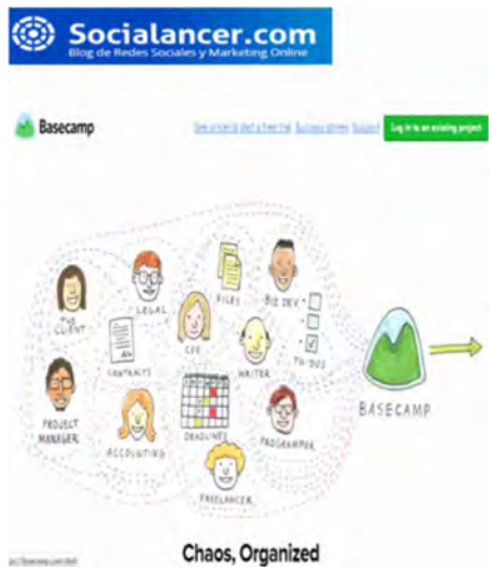
Figura 2. Página de inicio de BASECAMP.

Respecto a la presentación del programa BASECAMP disponible en su dirección, se muestra a continuación: