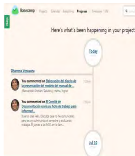
Figura 3. Progreso del proyecto.

Respecto al progreso del proyecto se observa en “Esto lo que está ocurriendo en su proyecto” como se observa en la siguiente figura: