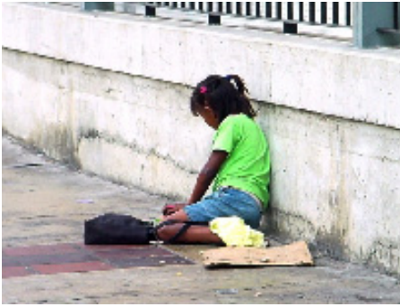
Los niños de la calle, tarde o temprano, arriban a la prostitución

difusión de imágenes fijas o en videos, de mensajes, imágenes denigrantes, reales o ficticias, de los niños acosados. Su importancia y gravedad obligan a una investigación amplia con acciones preventivas y de atención, simultáneas, en todos los estratos económico-sociales del país. En nuestro país, CECODAP ha elaborado y divulgado materiales didácticos sobre el tema. Uno de ellos, es la excelente publicación “Violencia en los pupitres”, de Fernando Pereira y Oscar Misle.