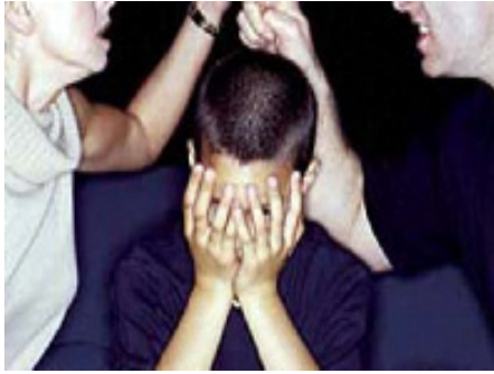
Los hijos de las parejas donde existe la violencia verbal o física, son víctimas indirectas y frecuentemente también son maltratados

promiscua, especialmente en adolescentes. En muchos casos se descubre por el embarazo de la niña maltratada. Otros tipos de maltrato tienen signos y síntomas diferentes: El Síndrome de Münchhausen por poder o delegación, descrito en niños en 1977, consiste en la invención o la creación de enfermedades o de lesiones en niños, generalmente pequeños, por parte de un familiar o cuidador, habitualmente la madre. Son adultos profundamente perturbados que hacen daño de dos formas: a través del tratamiento que aplica el personal de salud por enfermedades falsas, inventadas hábilmente por el adulto responsable del niño o por las enfermedades creadas en el niño por el progenitor perturbado al administrarle alimentos contaminados o inyectarle sustancias extrañas y nocivas.