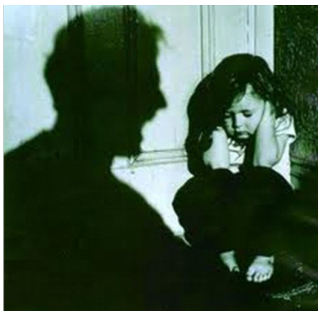
Las consecuencias psicológicas de los maltratos a niños generalmente son graves y permanentes

En octubre de 1990 se aprobó en Venezuela la Convención de los Derechos del Niño y ocho