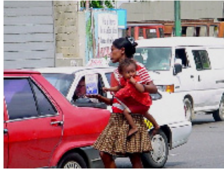
Los niños, frecuentemente, son utilizados para generar conmiseración

El tercer grupo: Maltrato y abandono, incluye dos grandes subgrupos Maltrato: que abarca los tipos clásicos de tipo físico (golpes, fracturas, mordeduras, quemaduras, sacudidas violentas, entre otras. Tipo sexual con dos grandes áreas: sin contacto físico que incluye exhibicionismo, voyeurismo, fotos y videos con sexo explícito, entre otras. La variante denominada con contacto físico tiene, a su vez, dos tipos: sin penetración, que constituyen la mayoría y con penetración: oral, vaginal, anal. El tipo negligencia u omisión, que aparentemente es el más frecuente en los países y organismos que investigan más profundamente la situación, consiste en descuidos intencionales de personas conscientes de cómo hacerlo correctamente. Por otra parte, existe el maltrato prenatal que