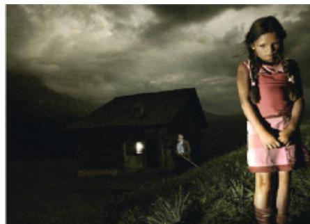
Las fugas del hogar son una manifestación frecuente de maltrato, especialmente de tipo sexual

En Colombia, el Instituto Colombiano de Bienestar Infantil, en 40460 denuncias sobre maltratos, diagnosticaron 30,8% de negligencia, 35,3% de maltrato físico; 17,4% de abuso o maltrato sexual; 4,3% de maltrato psicológico; 2,2% de explotación laboral y